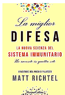
MATT RICHEL La miglior difesa: la nuova scienza del sistema immunitario HarperCollins, pagine 504, euro 22