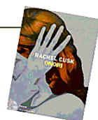
RACHEL CUSK Onori Einaudi, pagine 192, euro 16,50

Faye, una scrittrice di mezza età, è in viaggio per lavoro e ascolta un estraneo seduto accanto a lei mentre parla della sua famiglia e del suo lavoro. «Onori» di Rachel Cusk (Einaudi) è l'ultimo capitolo di una trilogia dopo «Resoconto» e «Transiti». La scrittrice compone un'architettura di chiacchiere e aneddoti per raccontare