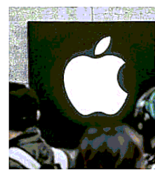
Tra le novità, un Apple Watch

Come ogni fine estate Apple è pronta a finire sotto i riflettori, svelando i nuovi gadget col marchio della mela morsicata. Una data c'è già - il 12 settembre allo Steve Jobs Theatre nel quartier generale di Cupertino, in California - mentre sui prodotti mancano certezze. Le indiscrezioni, tuttavia, tracciano a grandi linee cosa aspettarsi: gli iPhone, che quest'anno potrebbero essere tre e non due, insieme a un Apple Watch e agli auricolari senza fili AirPods. Il dispositivo