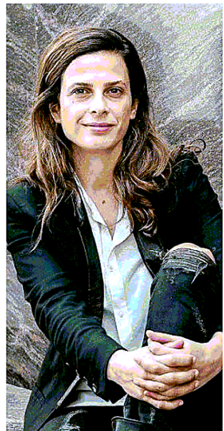
LA CARRIERA Francesca Bria, 39 anni, prima di Barcellona ha lavorato all'agenzia inglese Nesta

«Ripensare le smart city» è il titolo dell'incontro che Francesca Bria terrà insieme al politologo e giornalista Evgeny Morozov sabato 8 settembre nell'ambito del Festival della Comunicazione di Camogli (6-9 settembre) manifestazione ideata e diretta da Rosangela Bonsignore e Danco Singer e organizzata dal Comune di Camogli. La V edizione del festival avrà come tema «Visioni» e sarà aperta dalla lettura magistrale dell'architetto Renzo Piano (nella foto) sul rapporto fra architettura e società. Per quattro giorni oltre cento protagonisti dell'informazione, della cultura, dell'innovazione, dell'economia, della scienza e dello spettacolo si confronteranno in 78 incontri. Ad arricchire il programma (tutto gratuito), anche laboratori, mostre e spettacoli.