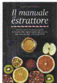
Il manuale dell'estrattore Martino Beria (Gribaudo, 14,90 €)

Harry Potter e la pietra filosofale approda al Teatro degli Arcimboldi di Milano e all'Arena Flegrea di Napoli in versione concerto, con gli 80 musicisti dell'Orchestra italiana del cinema che suoneranno dal vivo. Date: il 12, 13 e 14 maggio a Milano, il 2 e 3 giugno a Napoli. Acquista subito i biglietti per Milano su ticketone.it , per Napoli su etes.it