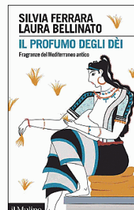
Silvia Ferrara Laura Bellinato "Il profumo degli dèi" il Mulino pp. 186, € 16

In una tavoletta d'argilla in lineare B sono state trovate incise queste parole: «OLIO da bollire, CORIANDOLO, CIPERO, ROSA, SALVIA, MIELE, VINO q.b.». Unalista di ingredienti forse incongrua, almeno ai nostri occhi che la leggono come la base materiale di una qualche ricetta alimentare. Quel q.b. - protagonista e demone d'ogni libro di cucina - lo testimonierebbe. Eppure non di pietanza edibile si tratta ma semmai, spiegano Silvia Ferrara e Laura Bellinato, di istruzioni indispensabili per realizzare un profumo. Nulla di strano. Un profumo, come s'intitola il loro libro insieme raffinato e colto, degno degli dèi. Un libro dove la dimensione accademica del saggio deve mescolarsi - dato ciò di cui tratta - con una dimensione necessaria e narrativa: un racconto in cui le autrici mettono da canto l'istanza ascetica dell'osservatore esterno per immergersi nel contesto che provano a esaminare, capire, interpretare.