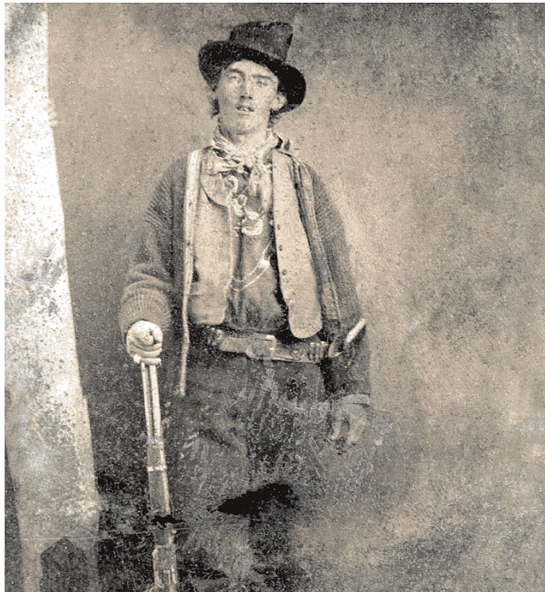
KILLER SPIETATO Billy the Kid (1859 - 1881), è stato un giovanissimo pistolero e criminale statunitense