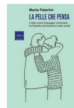
La pelle che pensa Marta Paterlini Codice Pag. 288; Euro 22,00

Di abbracci è piena la storia dell'arte, del resto questo gesto comunica molto più di tante parole. I filosofi greci avevano intuito millenni fa che questo modo di stringersi a un altro essere umano nascondeva il seme dell'empatia, mentre oggi la scienza lo considera uno strumento terapeutico. Molte ricerche hanno sottolineato l'importanza dell'abbraccio per lo sviluppo infantile, e si aprono anche nuove prospettive sul suo ruolo. Questo saggio esplora il potere del senso del tatto spaziando dalle neuroscienze alla filosofia, ricordando il valore simbolico di un gesto intimo e insieme politico. Nella nostra cultura un abbraccio celebra vittorie e sottolinea alleanze, ma apre anche una finestra sul nostro mondo interiore.