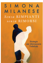
Senza rimpianti senza rimorsi S. Milanese Ponte alle Grazie P. 180; E 16

«Come sarebbe stato se...» è una frase che tutti abbiamo pronunciato nella vita, ma che nasconde una grande insidia: quella di restare imprigionati. Se una certa dose di rimpianti e rimorsi è inevitabile (chi rifarebbe davvero tutte le scelte che ha fatto?) bisogna evitare che il passato continui a gettare un'ombra sul presente. Il medico e psicoterapeuta Simona Milanese in questo saggio aiuta a individuare le strategie per trasformare i ricordi dolorosi in esperienze e occasioni di crescita personale. Solo rielaborando ciò che percepiamo come occasioni perse o errori possiamo capire le ragioni profonde dei nostri comportamenti e trasformarli in preziosi maestri, per affrontare il futuro con serenità e consapevolezza.