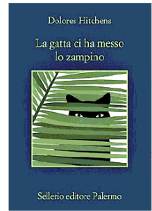
La gatta ci ha messo lo zampino Dolores Hitchens Sellerio, pp. 280, 15 euro

L'arrivo di una lettera inattesa sconvolge la vita ordinata delle sorelle Murdock e della gatta Samantha a Los Angeles. Ad inviarla è stata Prudence Mills, la nipote di una vecchia amica, che spera di poter contare sulle doti investigative di Miss Rachel. Prudence ha paura: solo pochi giorni prima, l'inquietante disegno di una mano mutilata, accompagnato da una scritta sibillina, è stato lasciato sotto la porta di casa Mills.