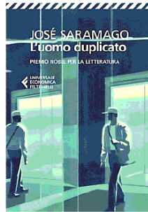
L'uomo duplicato José Saramago Feltrinelli, pp. 267, 12 euro

Protagonista è un professore di Storia di scuola media. Tertuliano Máximo Afonso è separato dalla moglie senza ricordare né perché si fosse sposato né perché avesse divorziato. Conduce una vita solitaria e noiosa, fino al giorno in cui non scopre una cosa incredibile. Dietro consiglio di un collega, noleggia una commedia leggera in videocassetta, ed eccolo faccia a faccia con una comparsa che, ben più che somigliargli, è proprio lui.