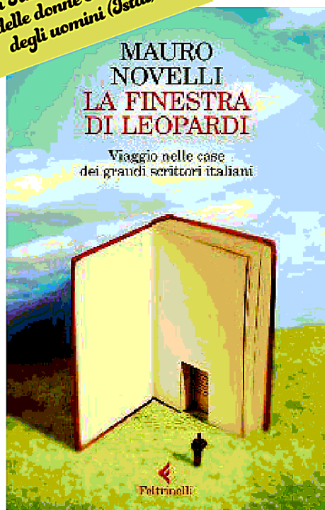
La finestra di Leopardi Mauro Novelli (Feltrinelli, 18 €)

In Italia legge il 471% delle donne e il 34,5% degli uomini (Istat)