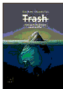
Trash Pietro Martin e Alessandra Viola (Codice Edizioni, 25 €)