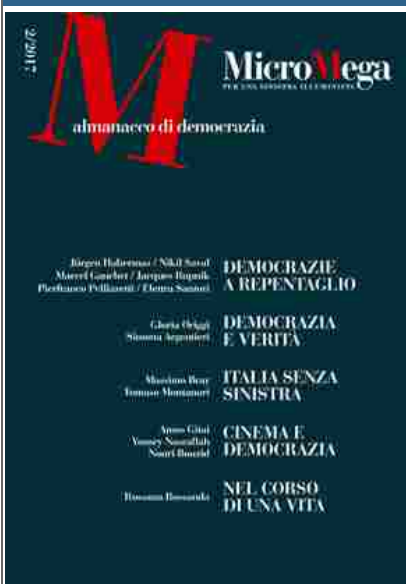
MicroMega 2/2017 - Almanacco di democrazia PRESENTAZIONE E SOMMARIO