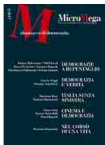
Almanacco di democrazia Sommario