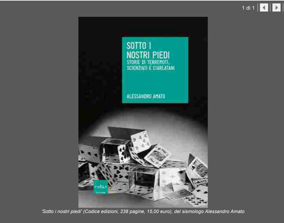
'Sotto i nostri piedi' (Codice edizioni, 238 pagine, 15,00 euro), del sismologo Alessandro Amato

Dalla faglia di Sant'Andrea alla Cina, fino alle macerie provocate a Colfiorito dal terremoto del 1997 e alla devastazione de L'Aquila del 2009: quello affrontato nel libro "Sotto i nostri piedi" (Codice edizioni, 238 pagine, 15,00 euro) è un viaggio attraverso i terremoti in compagnia del sismologo Alessandro Amato, dell'Istituto Nazionale di Geofisica e Vulcanologia (Ingv).